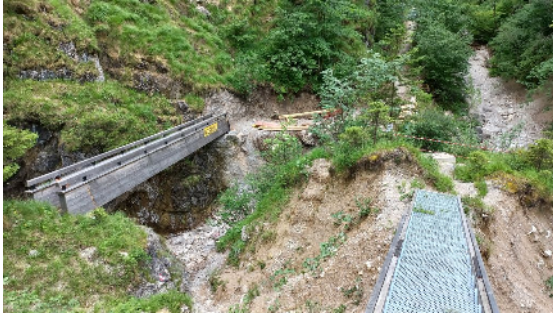
Neue Brücke und die alten Stufen

Im Goiserer Weißenbachtal wurden zahlreiche neue Wegweiser errichtet und mit den einheitlichen gelben Wegtafeln versehen. Dies betraf den Weg auf den Bärenpfad und den Anstieg auf die Knallalm. Beide Strecken sind in Beschilderung, Markierung und Wegpflege Dank eines eifrigen Helfers in mustergültigem Zustand.