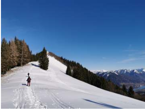
Zwölferhorn am 20. Jänner