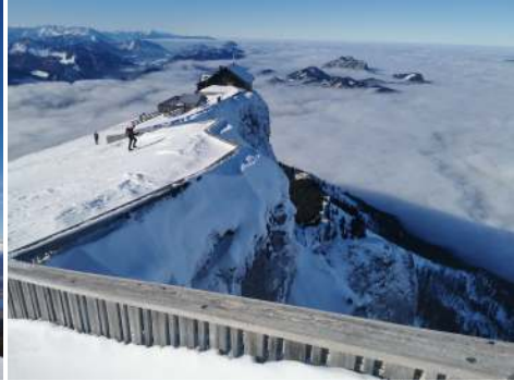
Schafberg am 3. Februar