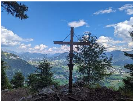
Tressenstein am 13. Juni

Ansprechperson und weitere Informationen über die Kosten (voraussichtlich 860 €) für die Busfahrt, Schiff und Halbpension: Helmut Winterauer