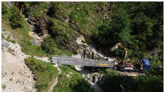
Einrichtung der neuen Brücke

Das größte Projekt war die Versetzung der 17 m langen Brücke im Talschluss beim Anstieg auf den Leonsberg. Dies war notwendig, da sich das Schottergelände oberhalb des Bachüberganges unaufhaltsam auflöste. Die Brücke wurde um etwa 20 m auf felsigen Untergrund versetzt und eine neue Wegführung mit Stufen angelegt. Da dies nur mit Hilfe einer Baufirma möglich war (Baggerungen, Schremmarbeiten, Betonieren von Fundamenten und Einsatz eines Kranes) mussten nicht unerhebliche finanzielle Mittel aufgewendet werden.