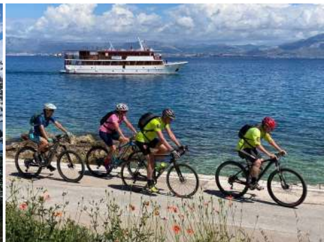
Schiffs- und Radreise ab 14. Juni